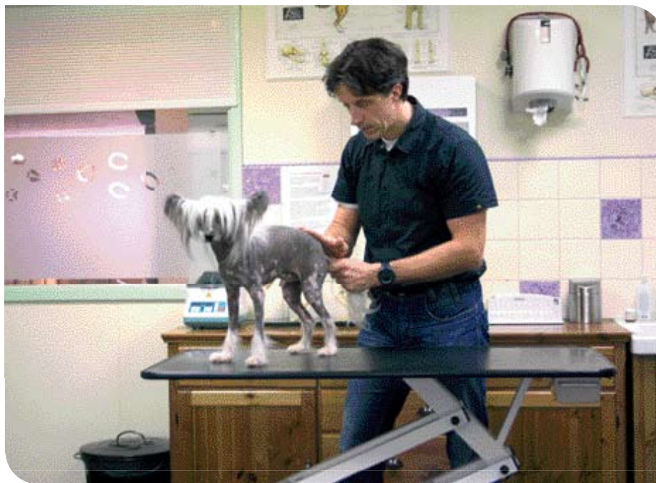
♦ Sacraaltherapie bij een Naakthond.

Wat wel een feit is, is dat reguliere diergeneeskunde en osteopathie elkaar enorm goed aanvullen. Als voorbeeld noem ik een hond met spondylose. Dit is een botwoekering aan de onderzijde van de rugwervels. De spondylose kan leiden tot blokkades en pijn. De reguliere diergeneeskunde kan de diagnose door middel van röntgenopnamen stellen.