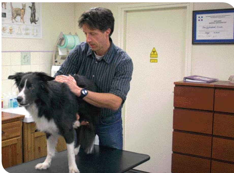
♦ Een viscerale (buik) techniek.