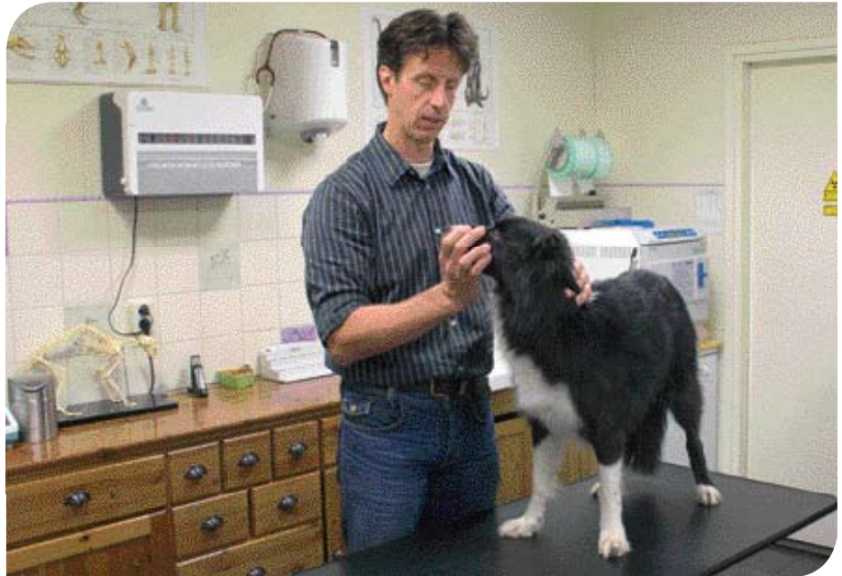
♦ Een achterhoofd - atlas behandeling.

Het cranio-sacrale systeem is de verbinding welke anatomisch bestaat tussen de schedel en het bekken. Het primaire ademhalingsstelsel wordt veroorzaakt door de periodische aanmaak van hersenvocht in de hersenen. Hierdoor zetten de hersenen enkele malen per minuut uit. De schedelplaten worden zo in beweging gezet. Via de ruggenmergvliezen worden deze bewegingen geleid naar het bekken. Spanningsverschillen in de hersenen hebben een invloed op het bekken en vice versa.